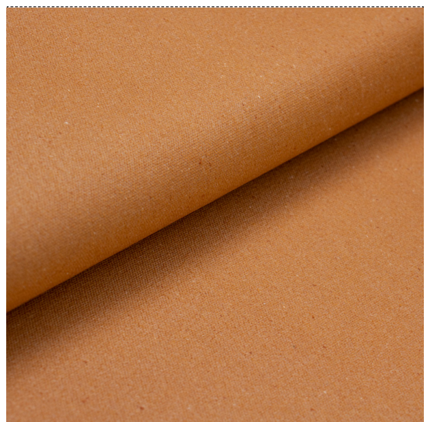
beschichtet / enduit 26100 - desert orange