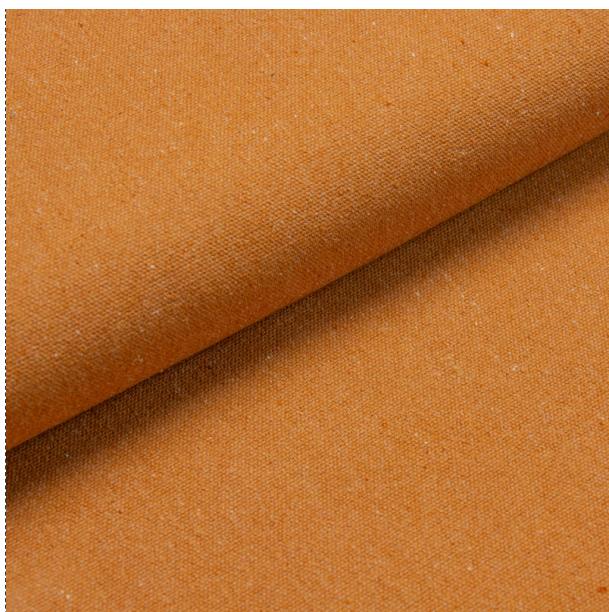
unbeschichtet / non enduit 24583 - desert orange