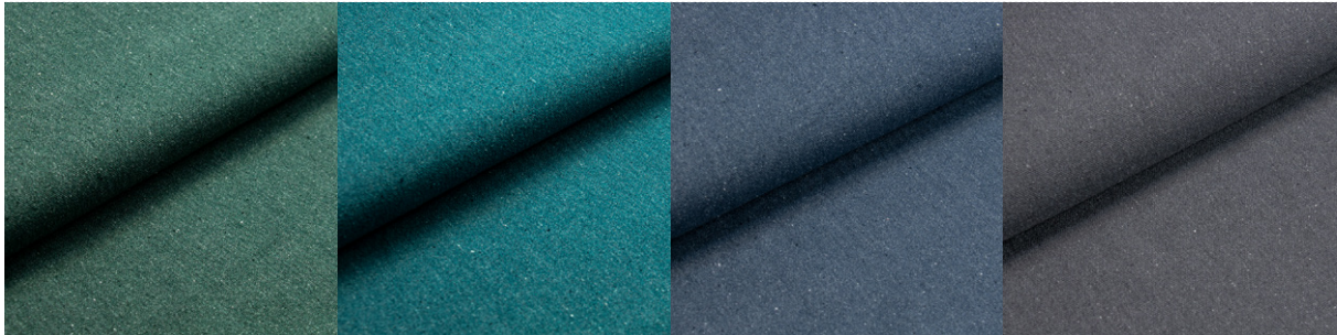
23871 / 26102 - forest dunkelgrün vert foncé