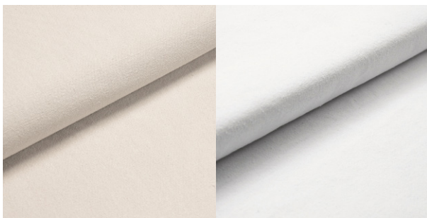
23874 / 26092 - sand ecru écru