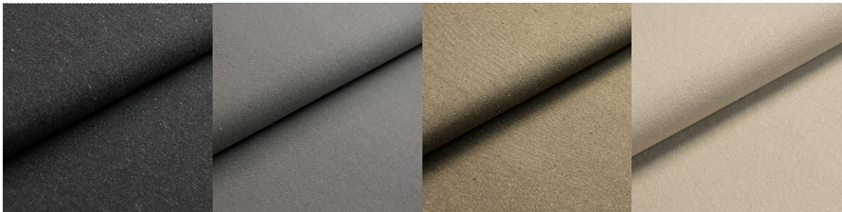
26078 / 26096 - lava schwarz noir