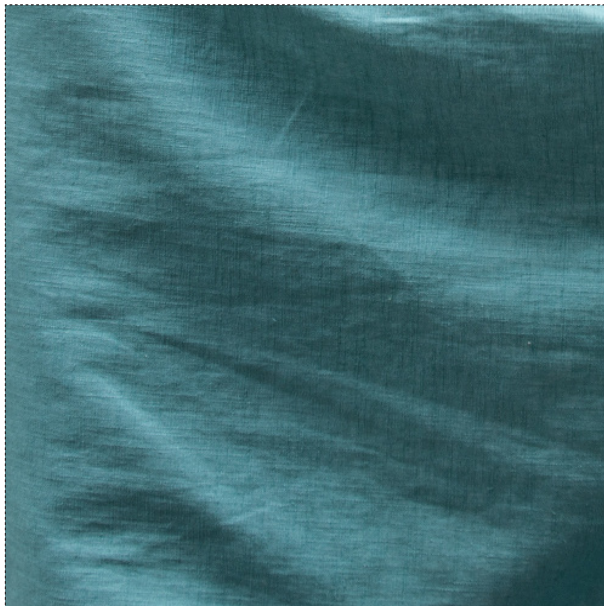
23275 seeblau / bleu océan