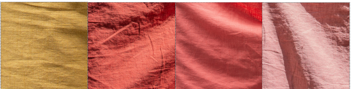
23270 ocker / ocre