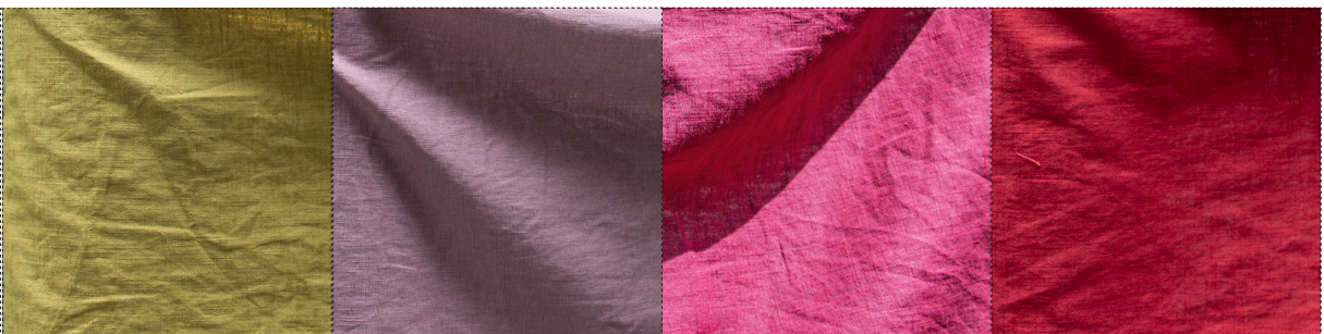
23269 moosgrün / vert mousse