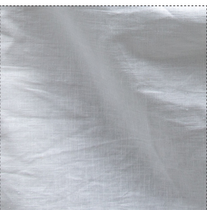
23120 weiss / blanc