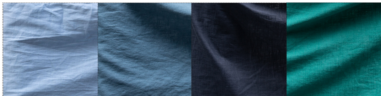
27022 hellblau / bleu clair